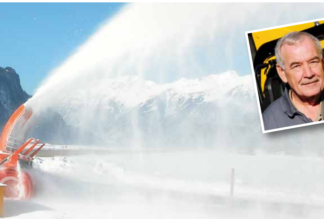
Mitarbeiter des Schneeräumungs-Kommandos fräsen mit dem Intrac-Peter die Fangnetze frei.

1999, als wir die Räumungsarbeiten auf dem Flugplatz einstellten, um bei der Säuberung der öffentlichen Strassen zu helfen. Damals ging nichts mehr, mussten Material- und Personentransporte aus Interlaken via Kiesschiff nach Brienz erfolgen.