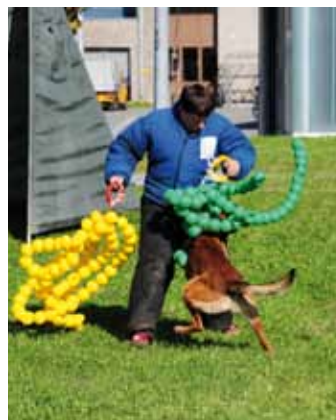
Auch die Diensthunde hatten ihren Auftritt vor dem ausländischen Publikum.

erhalten, sondern am Ende auch bewerten, inwiefern OSZE-Standards eingehalten werden.