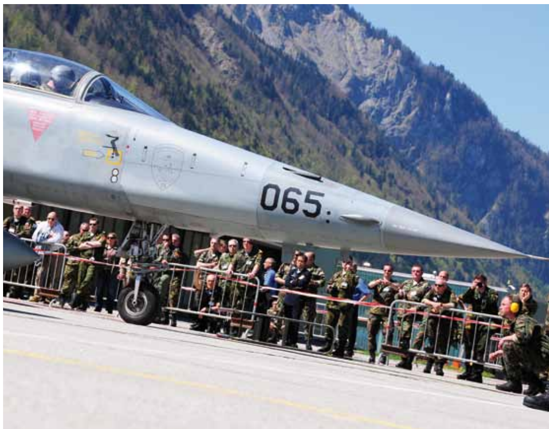
Den OSZE-Beobachtern wird ein F-5-Tiger-Kampfjet präsentiert.

Was 41 Vertreter der OSZE-Staaten Ende April auf dem Militärflugplatz Meiringen-Unterbach zu sehen bekamen.