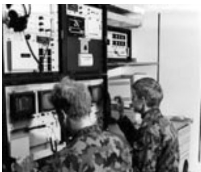
À l'intérieur de l'installation.

Après la fête qui a marqué la prise du drapeau sur la place du village de Stans, le commandant