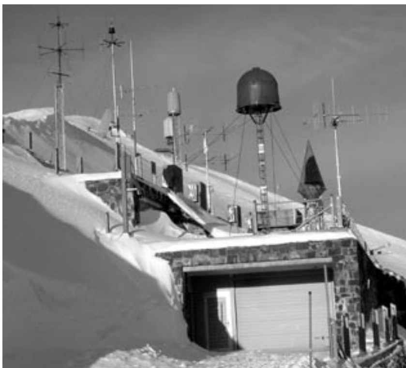
Une véritable forêt d'antennes.

Consolider le groupe, telle est la nouveauté la plus importante et simultanément la plus grande performance. Alors que les autres groupes disposaient déjà dans Armée 95 d'états-majors opérationnels, le groupe 3, quant à lui, a dû composer son état-major de toutes pièces sur le plan du personnel. C'est pourquoi l'état-major était constitué au début d'éléments très hétérogènes et ce n'est que petit à petit qu'il a saisi la nature de la CGE. Les visites de l'état-major au front ont largement contribué à la considération et à l'estime