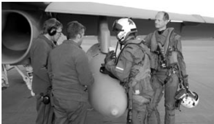
Zurück vom Einsatz: Die Piloten unterschreiben den Flugrapport.

La collaboration avec les Norvégiens et les Suédois est excellente.