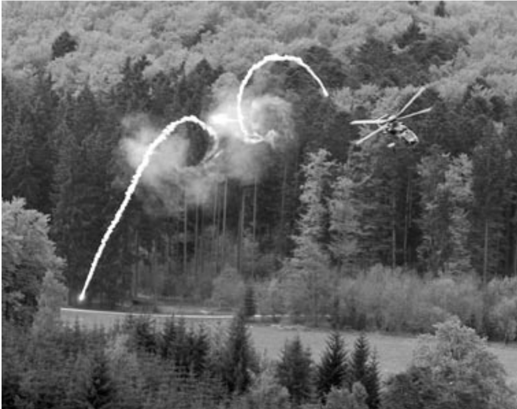
Un hélicoptère suisse de type Cougar se protège contre le tir d'engins guidés par le déclenchement de leurres (Flaires).

Pour la première fois, les engagements en vol ont pu être évalués presque en temps réel.