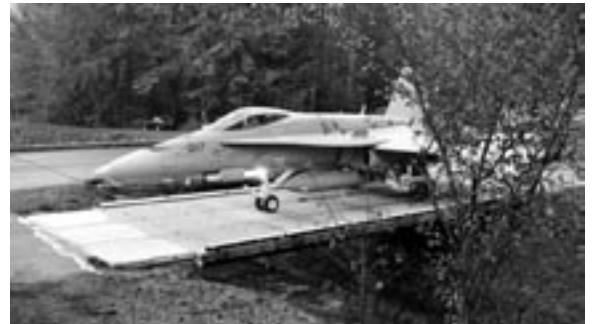
Un F/A-18 sur un pont de remplacement.

« L'exercice nocturne en vue d'éteindre un incendie et de porter secours après la chute d'un avion a été probablement l'intervention simulée la plus violente à laquelle j'ai participé jusqu'ici. La situation était également spéciale parce que nous avons déjà été sollicités pendant la journée et que nous ne nous attendions donc plus à ce qu'un autre événement se produise. Toute l'opération s'est ensuite développée de manière réaliste, ce qui me semblait être une très bonne chose. L'exercice m'a de toute façon fait découvrir de nouveaux aspects intéressants. Et je crois également que nous nous en sommes bien sortis. Nous avons trouvé le deuxième des deux pilotes blessés en moins d'une heure. Il va de soi que l'obscurité n'a pas facilité l'accomplissement de cette opération »