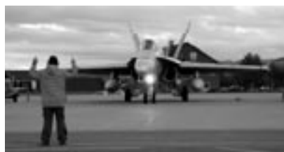
Un F/A-18 en route pour l'engagement.

a demandé si un F/A-18 ne pourrait pas procéder à un atterrissage à Ørland avec le nouveau câble de retenue installé sur la piste. Les F-16 disposent certes d'une crosse d'appontage mais réservée exclusivement aux cas d'urgence comme pour nos Tiger. De tels atterrissages font partie du programme obligatoire des pilotes suisses et sont fort appréciés. Le dernier atterrissage du Nordic Air Meet 06 a donc eu lieu avec la crosse d'appontage sortie, à la grande