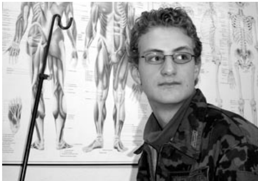
Les recrues s'entraînent au massage cardiaque RCP.

connaissances à jour». Outre les gestes qu'on y apprend, le cours est également utile pour la vie civile. L'instruction RCP peut également compter pour le cours de premiers secours ■