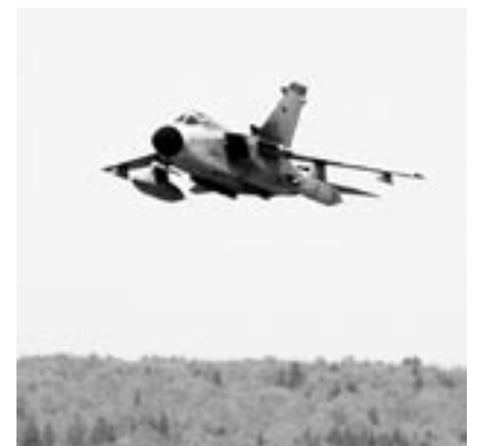
Tornado volant à basse altitude.

« La Suisse est très active. Si vous jetez un regard rétrospectif, vous remarquez que la participation de la Suisse avec des forces armées lors d'engagements visant à l'établissement ou à la promotion de la paix existe depuis fort longtemps. Nous sommes donc très reconnaissants de pouvoir saluer ici nos proches voisins lors de l'exercice ELITE. Pour moi, la Suisse est justement un bon exemple d'un pays qui participe depuis longtemps et de manière intensive à des exercices et qui prend au sérieux son partenariat pour la paix (partnership for peace). La Suisse a tiré profit des expériences qu'elle a faites avec nous, à savoir l'OTAN, pour ses propres engagements. La Suisse saisit cette opportunité. Je pense également que la Suisse nous apporte beaucoup grâce à son équipement technique et à ses idées. ■