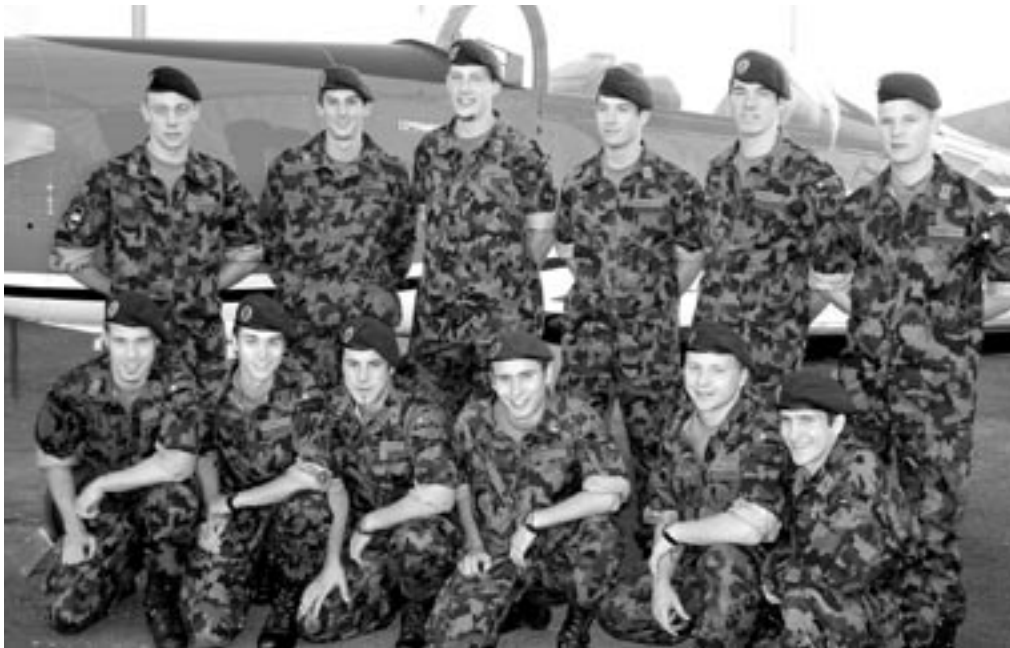
Ces douze candidats pilotes militaires ont été engagés par les Forces aériennes et étudient actuellement à la Haute Ecole spécialisée zurichoise de Winterthur

Les 12 candidats pilotes ont tous reçu le brevet de lieutenant de l'armée par la voie normale.