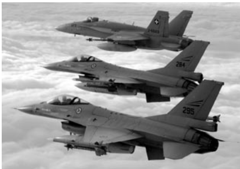
Deux F-16 norvégiens et un F/A-18.

Un événement survenu à la fin de la seconde semaine a apporté la preuve que nous sommes les bienvenus avec nos F/A-18. On nous