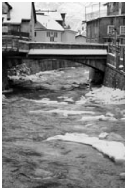
Un ruisseau romantique peut se transformer en courant impétueux.