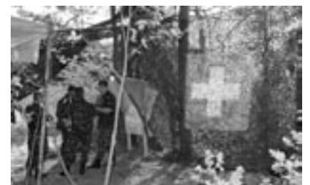
Drapeau suisse camouflé.