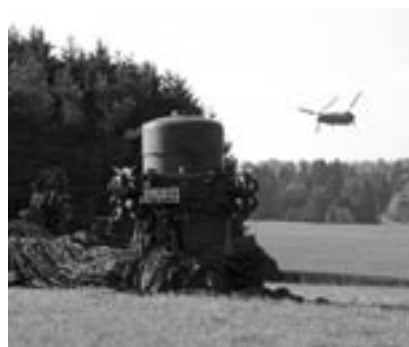
Rapier contre CH-53.