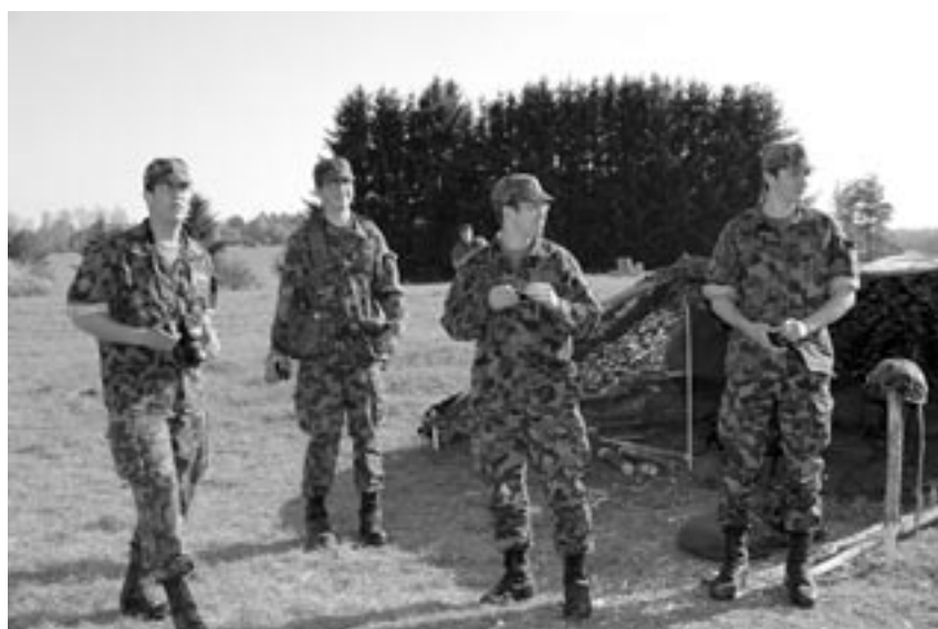
Militaires de l'unité de feu.