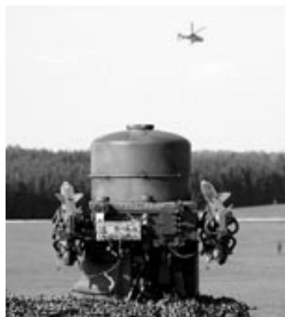
Rapier contre Cougar.

pourrions acquérir des expériences précieuses s'il nous était possible d'intégrer les divers systèmes dans l'exercice ELITE ». Les soldats et les sous-officiers concernés dont un grand nombre provient également de la milice tirent aussi un bilan positif. La mission est jugée intéressante. On soigne les contacts avec les soldats issus d'autres nations, notamment ceux provenant d'Allemagne et d'Autriche qui sont logés dans le même bâtiment que les Suisses. Ces contacts ont lieu le soir après le travail ou les week-ends pendant le match de football, voire lors d'une excursion dans cette région au paysage pittoresque. ■