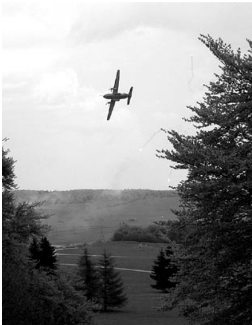
CASA 295M, lancement de leurres.

Vraisemblablement pas. ELITE est un exercice auquel nous invitons les Etats de l'OTAN ainsi que les pays qui appartiennent à EURAC (note de la rédaction : European Air Chiefs Confe-