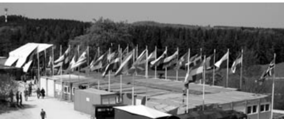
La Suisse et 22 autres nations.

Sous la conduite du commandement de la Luftwaffe Sud, la Bundeswehr allemande a effectué pour la onzième fois l'exercice ELITE. Quelle est l'origine de cet exercice ? Et quels en sont les objectifs ?