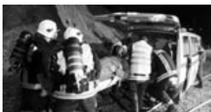
L'unité des sapeurs-pompiers.

Une base aérienne militaire est de nos jours également un événement d'intérêt public.