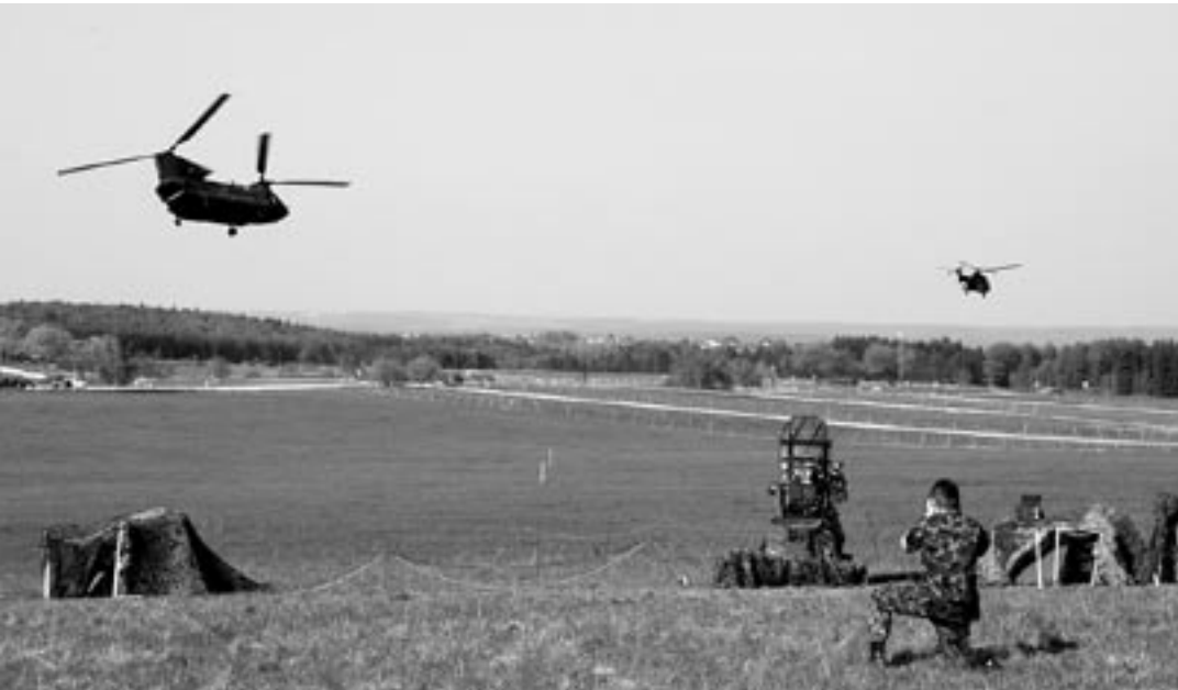
Rapier contre CH-53 et Cougar.

Les scénarios de combats au sol modernes se déroulent en temps réel.