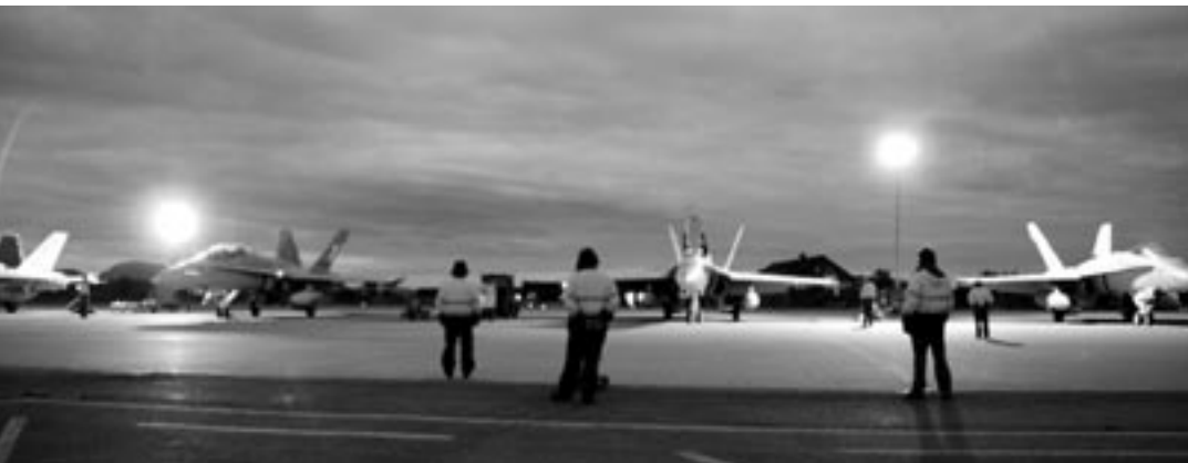
Le service de vol de nuit.

Le vol tactique était l'élément primordial du Nordic Air Meet qui s'est déroulé du 27 septembre au 5 octobre 2006 sur la base aérienne norvégienne d'Ørland. Une délégation des Forces aériennes suisses y a participé pour la deuxième fois. Onze pilotes engagés avec leurs cinq avions de combat F/A-18 ont fait une forte impression.