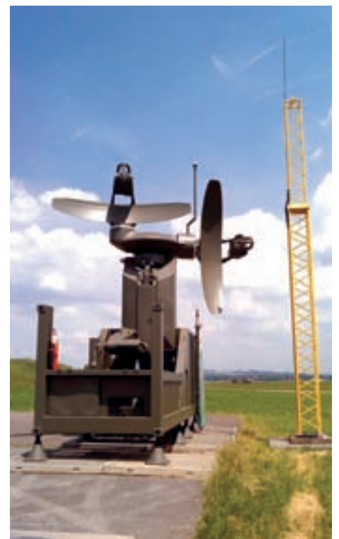
» Präzisionsanflugradar in Emmen