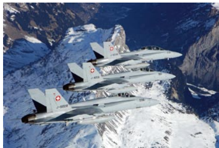
F/A-18 Hornet in volo sopra le Alpi.

I jet da combattimento del tipo F-5 Tiger e F/A-18 Hornet vengono impiegati essenzialmente per effettuare allenamenti al combattimento aereo. Per i piloti, l'unico modo per prepararsi al caso effettivo è quello di svolgere un allenamento intensivo sull'arco di vari anni. Questo ha luogo principalmente nell'arco alpino poco popolato e ad altitudini superiori ai 4000 metri sopra il livello del mare. Durante la pianificazione degli impieghi ci preoccupiamo di ripartire equamente i voli tra i vari settori d'allenamento.