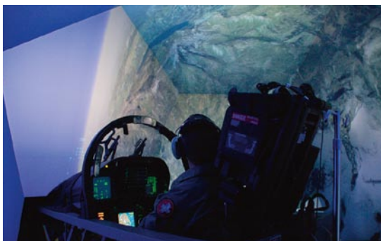
L'impiego di simulatori consente di ridurre il numero di voli.

Anche per quanto riguarda i propulsori sussistono dei limiti tecnici. Le turbine più silenziose montate sui moderni aerei passeggeri non sono adatte per i velivoli da combattimento. Infatti, non sono sufficientemente potenti per poter raggiungere le velocità necessarie e sono troppo ingombranti per poter essere montate sui jet da combattimento relativamente compatti.