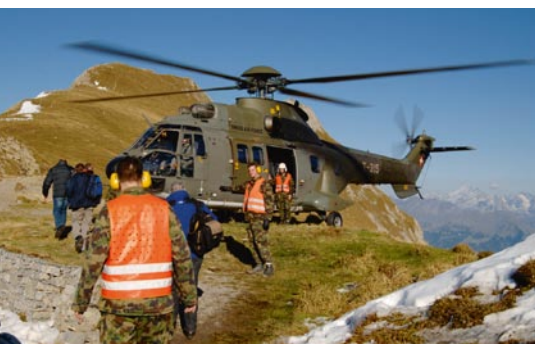
Trasporto di persone in montagna.

Gli elicotteri possono essere impiegati in modo flessibile. Volano ad altitudini moderate e vengono utilizzati per il trasporto di persone e materiale, sia per l'esercito sia, in via sussidiaria, a favore della popolazione e delle autorità. Non di rado vengono utilizzati per interventi di aiuto e di salvataggio a ogni ora del giorno e della notte, per esempio in caso di incendi boschivi, di alluvioni o di valanghe. Gli elicotteri del tipo Super Puma, equipaggiati con una videocamera a immagine termica, vengono spesso impiegati per la ricerca di persone disperse o ferite. Durante queste operazioni si vola a bassa quota anche di notte.