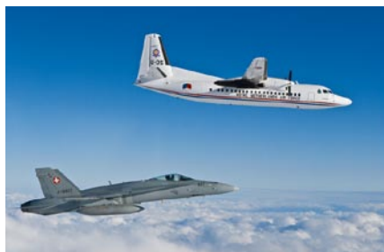
Servizio di polizia aerea con F/A-18.

Il mondo politico ha affidato tre compiti alle Forze aeree, ovvero: