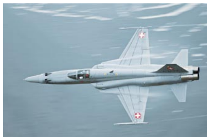
F-5 Tiger in volo a bassa quota.

Talvolta vengono effettuati anche voli a bassa quota, ma comunque in misura assolutamente minima. Dato che di norma i velivoli che volano a bassa quota appaiono all'improvviso e di sorpresa, possono spaventare sia gli adulti che i bambini, e anche gli animali. I voli a bassa quota sono essenzialmente necessari per l'allenamento della difesa contraerea. Anche in caso di cattivo tempo i piloti sono spesso obbligati a volare a quote inferiori del solito.