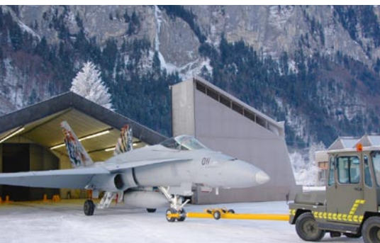
Edificio in cui vengono effettuate le prove di funzionamento dei propulsori.