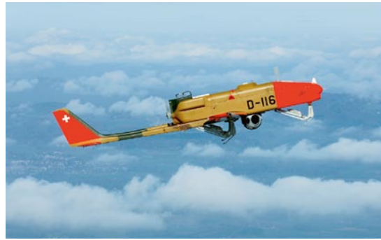
Un ricognitore telecomandato del tipo Ranger.

I drone del tipo Ranger vengono regolarmente utilizzati per impieghi a favore della sicurezza nazionale. Le loro immagini d'esplorazione si rivelano utili sia per il Corpo delle guardie di confine sia per la polizia e per l'esercito. Mentre i voli d'allenamento notturni sono limitati a poche settimane all'anno, gli impieghi sono sempre possibili, 24 ore su 24. Per motivi tattici si vola alla maggior altitudine possibile onde evitare di essere sentiti o visti. Tuttavia, le condizioni meteorologiche possono costringere i piloti di drone a volare ad altitudini inferiori nei casi in cui la visuale della telecamera di ricognizione risulti ostacolata dalla nebbia o dalle nuvole. Talvolta è anche necessario ripiegare verso un'altezza di volo inferiore a causa della complessa struttura dello spazio aereo in Svizzera.