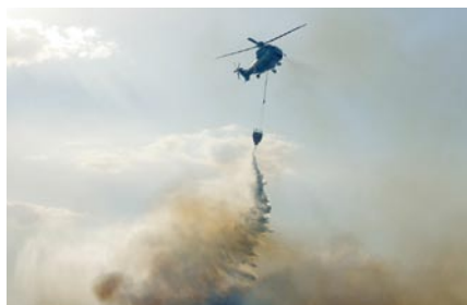
Super Puma impegnato in un'operazione di spegnimento.

La protezione dello spazio aereo comprende la difesa aerea nel peggior caso immaginabile – il conflitto bellico. Fanno parte della protezione dello spazio aereo anche il servizio di polizia aerea che garantisce la sovranità del nostro Paese nella terza dimensione, per esempio sorvegliando e imponendo zone di divieto di volo in occasione di importanti manifestazioni, quali il World Economic Forum (WEF) oppure EURO 08.