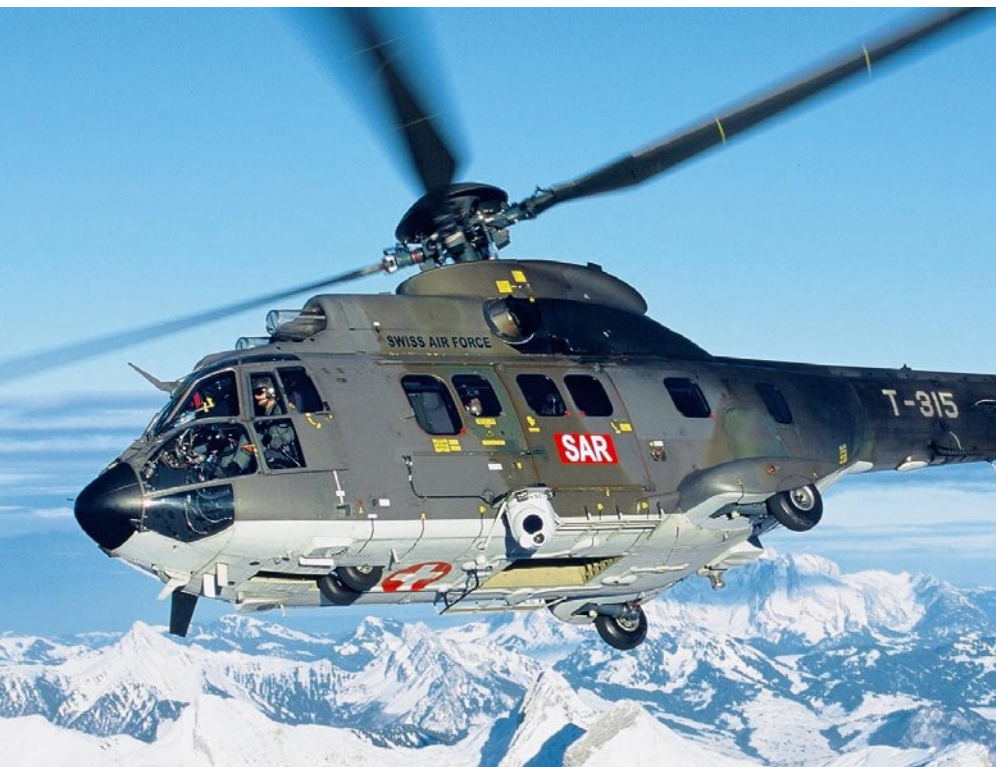
Super Puma equipaggiato con videocamera a immagine termica.