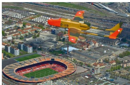
Drone impiegato durante EURO 08.

Per mezzo di elicotteri e aeroplani vengono trasportate truppe nonché materiale e vengono effettuati voli a favore delle autorità, della polizia e del Corpo delle guardie di confine. Il trasporto aereo comprende anche i voli di salvataggio e l'aiuto in caso di catastrofe in Svizzera e all'estero con interventi quali il ponte aereo per Engelberg dopo gli episodi di maltempo del 2005.