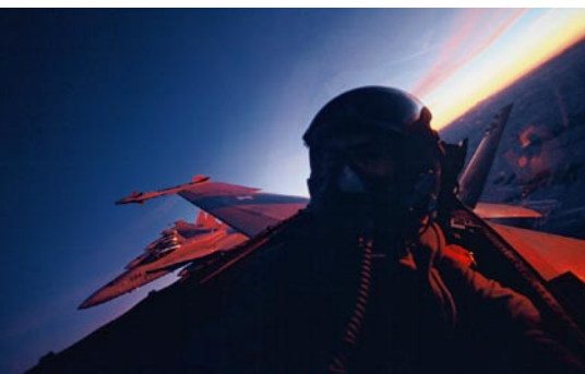
I voli notturni durano al massimo fino alle ore 22.

Le Forze aeree sono costantemente impegnate a ridurre al minimo il rumore provocato dai velivoli durante l'adempimento dei compiti. Ad eccezione delle poche settimane in cui le Forze aeree svolgono i loro annuali corsi di ripetizione (CR), per quanto riguarda i voli d'istruzione e d'allenamento sono applicabili le seguenti regolamentazioni: